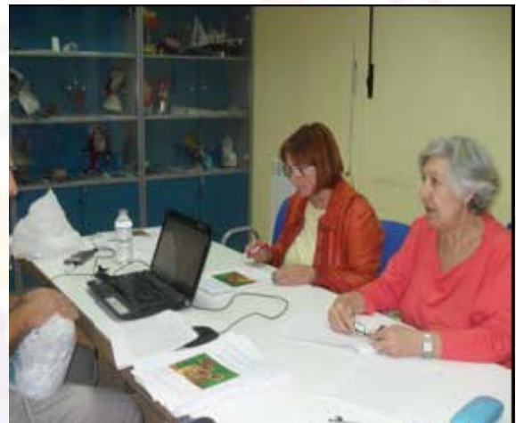
Explicando cómo se tiene que hacer el tratamiento

El pasado día 1 de noviembre AFIBROSAL participó en este estudio pese a ser un día de fiesta. “Reishi” es el nombre común de la seta que produce un hongo denominado Ganoderma lucidum . A nivel nutricional el reishi es un alimento registrado y aprobado para el consumo humano por la Agencia Española de Seguridad Alimentaria, cuyo consumo no posee ningún riesgo por la salud, consumiéndose por sus propiedades benéficas desde hace más de 2000 años.