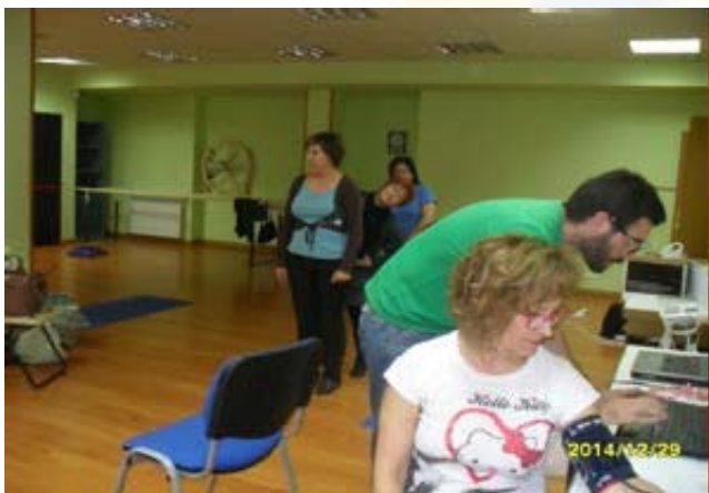
Realizando pruebas de tensión y peso

todas las personas que tenemos Fibromialgia. Si hay algo que caracteriza a esta entidad es que siempre está dispuesta a colaborar en pro de la mejoría de las personas afectadas, claro eso requiere un esfuerzo. Por ello, desde este medio aprovecho la ocasión para darle las gracias públicamente a las personas que han colaborado y a los Investigadores que, a pesar de llevar un trabajo extremo durante la semana, nos trataron muy bien y nos agradecieron nuestra colaboración. Ahora tenemos que seguir haciendo lo que nos han dicho y en el mes de diciembre vuelven a realizarnos otro control para ver los efectos.