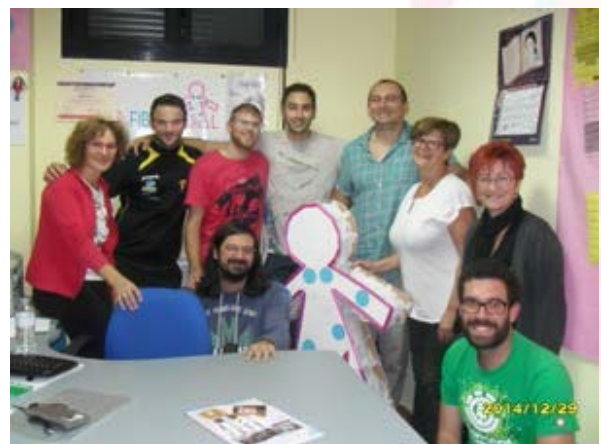
El equipo en la sede de Afibrosal