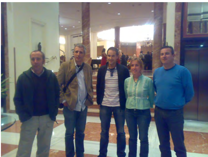
Miembros fundadores. Madrid 2010

Esta entidad dedica su labor a la prevención del esófago de Barrett y el apoyo de personas que viven con la enfermedad.