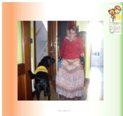
Perros de asistencia