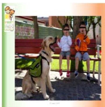
Perros de terapia

asistencia para su posterior entrega a personas con distintos tipos de discapacidad.